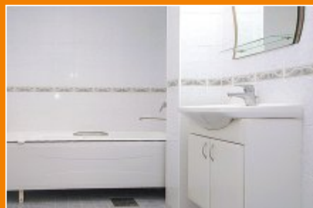
Часть квартир комплекса сдается с чистовой отделкой по стандарту ЮИТ ДОМ.