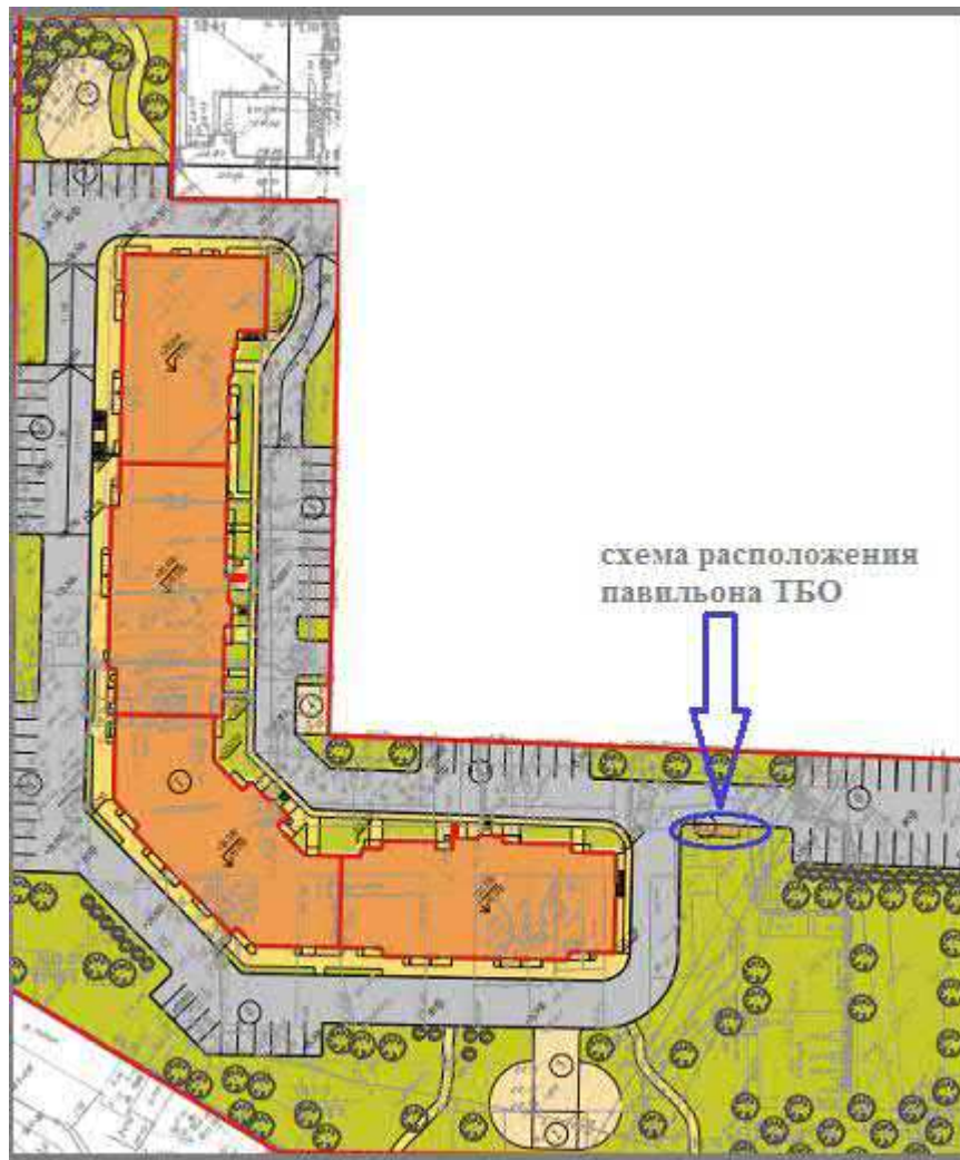
схема расположения павильона ТБО