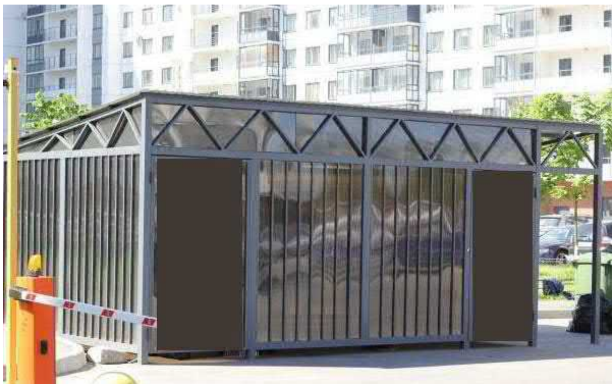
Схема расположения павильона ТБО открытого типа