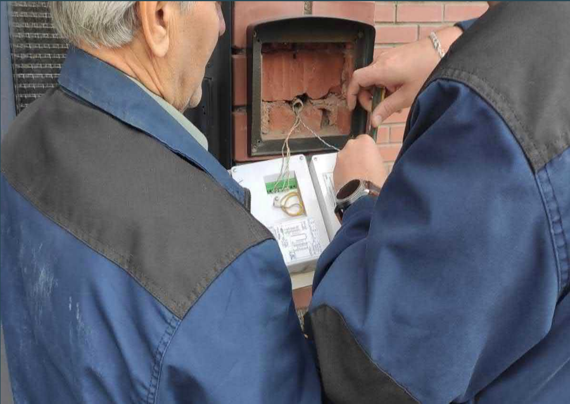
Замена блока вызова домофона