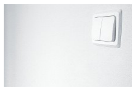
На ровных стенах устанавливаются импортные выключатели и розетки.