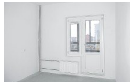
Все поверхности в квартирах качественно выравниваются.