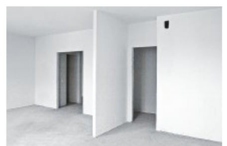
Квартыры Второго Западного корпуса сдаются с подготовкой под чистовую отделку.