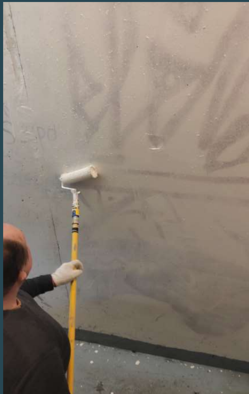
Удаление вандалных надписей