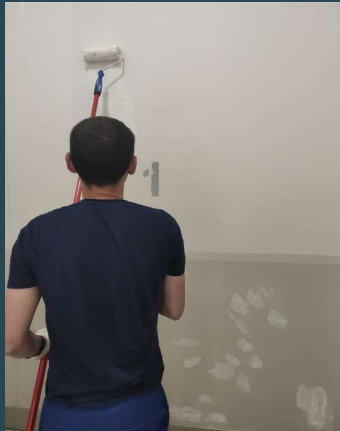
Окраска стен в МОП